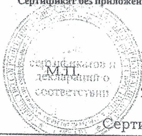
Схема сертификации № 3. Сертификат без приложения не действителен.