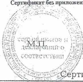
Схема сертификации № 3. Сертификат без приложения не действителен.