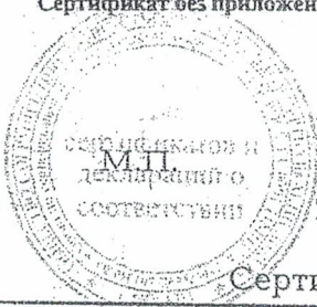
Схема сертификации № 3. Сертификат без приложения не действителен.