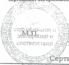
Схема сертификации № 3. Сертификат без приложения не действителен.